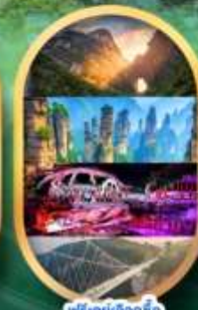
ฟรีคีย์เลือกซื้อ Option เสริม