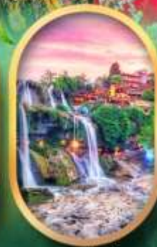
ฟูหลงเจินน้ำตก