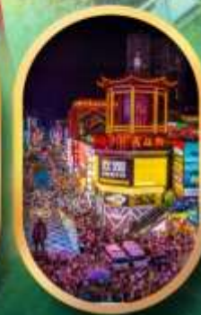
ถนนคนเดินซิงสู่