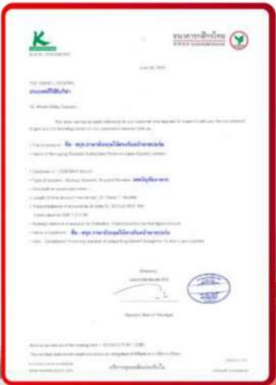
ตัวอย่าง Bank Guarantee ที่ผู้สมัครต้องยื่นกับสถานทูต