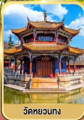
วัดหยวนกง