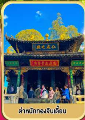
ตำหนักทองจินเตียน