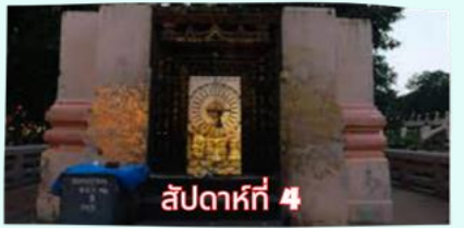
รัตนขรเจดีย์ (ซุ้มเรือนแก้ว)

เรียบร้อยแล้ว นำคณะจาริกบุญสวดมนต์ทำวัตรเย็น บูชาพระรัตนตรัย และสวดมนต์บูชาสังเวชนียสถาน จากนั้นเชิญท่านทัศนารธรรม นั่งสมาธิปฏิบัติบูชาตามอธยาศัย สมควรแก่เวลา นัดหมายเวลาเชิญท่านกลับโรงแรมที่พัก