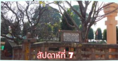
ราชายตนะ (จำลอง)