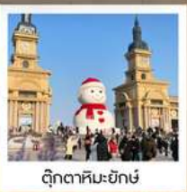
ตึกตาคิมะยักซ์