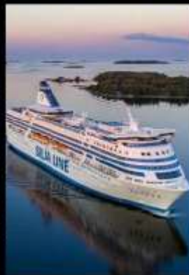
SILJA LINE OVERNIGHT CRUISE