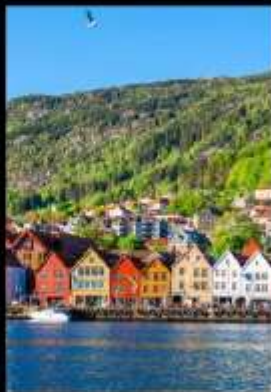
เมืองท่าแสนสวย เบอร์เก็น