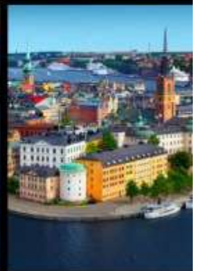
เที่ยว 4 เมืองหลวง แห่งสแกนดิเนเวีย