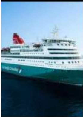
GO NORDIC OVERNIGHT CRUISE