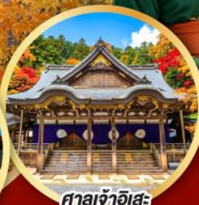
ศาลเจ้าฮิสะ