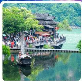
หมู่บ้านชาวน้ำเสี่ยเหรินเจีย