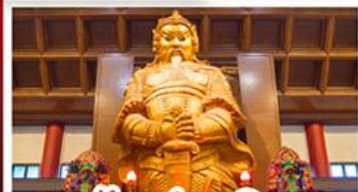
วัดเขกทมิว