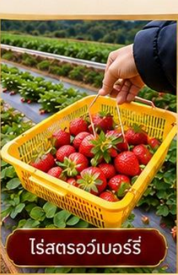
ไร่สตอร์วเบอร์รี่