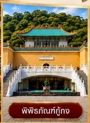
พิพิธภัณฑที่กู๊กง