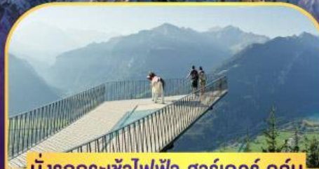
นั่งรถกระเช้าไฟฟ้า ชาร์เตอร์ ตูลุม