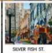
SILVER FISH ST.