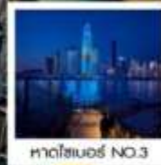
หาดโซเบอร์ NO.3

ของที่ระลึก สุดพิเศษ!! ขวดเบียร์สกรีนรูปของท่าน รัับฟรี!! ท่านละ 1 ขวด