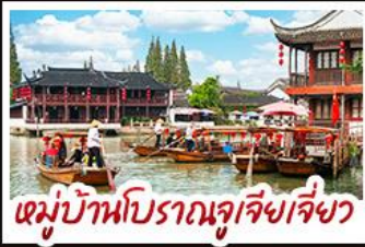
หมู่บ้านโบราณจูเจียงเจี๋ย

04 - 08 ธ.ค. 69 24,900 09 - 13 ธ.ค. 69 24,900 17 - 21 ธ.ค. 69 23,900 24 - 28 ธ.ค. 69 26,900 29 ธ.ค. - 02 ม.ค. 70 28,900 30 ธ.ค. - 03 ม.ค. 70 28,900