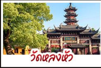
วัดเซหลงเซวี่