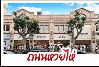
ถนนเซวี่ไผ่