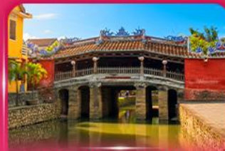
สะพานญี่ปุ่นโบราณ ฮอยอัน