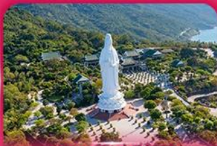
องค์กวนอิม วัดหลินอิ่ง