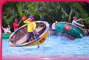
ล่องเรือกระดัง หมู่บ้านกิมทาน