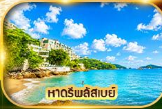
หาดรัทลัสสมัย