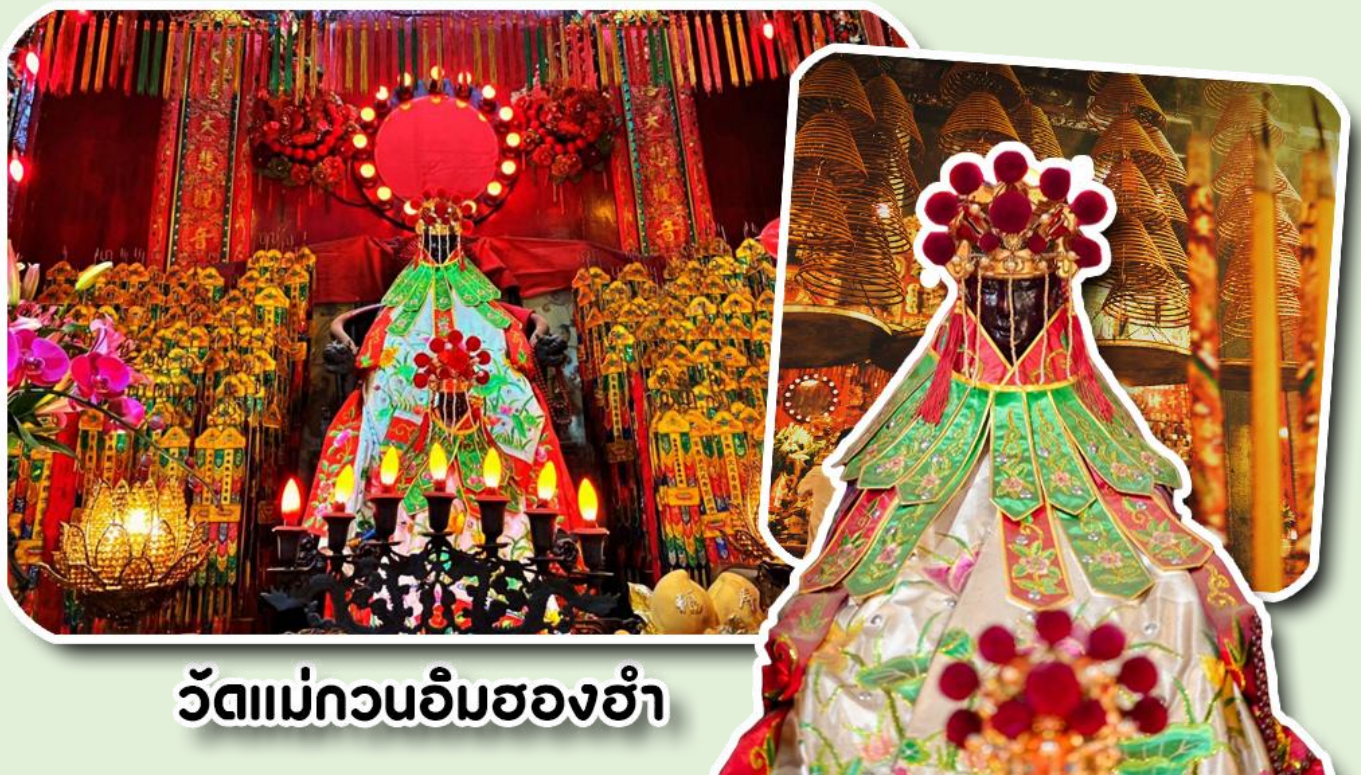
วัดแม่กวนอิมฮองฮำ

พาท่านเดินทางไปไหว้ขอพรขอเงิน วัดแม่กวนอิมฮองฮำ วัดเก่าแก่ของฮ่องกงสร้างตั้งแต่ปี ค.ศ. 1873 เป็นวัดขนาดเล็กที่มีชาวฮ่องกงศรัทธาแน่นถือกันเป็นอย่างมาก วัดแห่งนี้เป็นที่ประดิษฐาน องค์เจ้าแม่กวนอิมฮองฮำ ที่มีชื่อเสียงเรื่องการให้กู้ยืมเงิน เชื่อกันว่าท่านช่วยพลิกฟื้นเศรษฐกิจของชาวฮ่องกง ผู้คนจึงนิยมมาขอยืมเงินทำธุรกิจจนสำเร็จร่ำรวย รุ่งเรือง โดยให้ท่านอธิษฐานขอพรต่อหน้าเจ้าแม่กวนอิมฮองฮำ พร้อมกับระบุวันเวลาในการขอพรด้วย จากนั้นนำธูปธูปตามฐานะและศรัทธาที่เราจะนำเป็นสื่อในการขอพร เขียนจำนวนเงินที่ต้องการลงไปด้วย ใส่สกุลเงินยี่งดีใหญ่ แล้วนำเงินใส่ในซองแดง ควรเตรียมซองแดงไปเอง นำซองแดงไปวนรอบกระถางธูป วนขวาจำนวน 3 ครั้ง แล้วเก็บซองแดงในกระเป๋าสตางค์ เป็นเงินขวัญถุง ถ้าประสบความสำเร็ตามที่ตั้งหวัง ให้นำเงินในซองแดงทำบุญหยอดตู้ที่วัดแห่งนี้ในโอกาสต่อไป วิธีไหว้ให้ปัง ให้ได้โชคลาภเงินทอง ต้องไปกับเราเท่านั้น