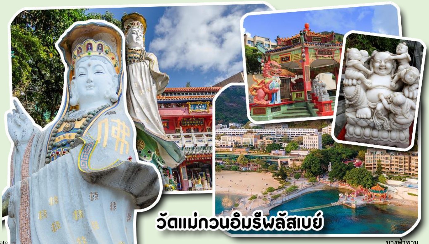
วัดแม่กวนอิมริพลัสเบย์

จากนั้นพาท่านเดินทางไปนมัสการ เจ้าแม่กวนอิมริมหาดริพลัสเบย์ วัดแห่งนี้ถูกสร้างขึ้นเพื่อคุ้มครองชาวประมงเวลาออกเรือไปหาปลาในสมัยก่อน บริเวณวัดมีสิ่งศักดิ์สิทธิ์มากมาย ได้แก่ เจ้าแม่กวนอิม ประดิษฐานอยู่ทางด้านซ้ายของวัด ซึ่งผู้คนนิยมเดินทางไปกราบไหว้ขอพรเรื่องการมีบุตร และยังมีพระสังกัจจายที่เชื่อกันว่าสามารถขอเพศของบุตรที่จะมาเกิดได้ โดยหลังจากกราบไหว้แล้วก็ให้ลูบที่ท้องของพระสังกัจจาย ถ้าอยากได้ลูกชายให้ลูบท้องซ้าย อยากได้ลูกสาวให้ลูบท้องขวา ถัดมาคือ เจ้าแม่ทับทิมเทพีแห่งท้องทะเล ท่านจะคอยคุ้มครองผู้เดินทางทางเรือ หรือผู้ที่เดินทางไปไหนมาไหนท่านจะคอยคุ้มครองให้ปลอดภัย และมีโชคลาก ถัดจากบริเวณที่กราบไหว้ขอพร ก็จะมีศาลาแปดเหลี่ยมริมน้ำ และสะพานเล็กๆ ที่ชื่อว่าสะพานต่ออายุ ซึ่งเชื่อกันว่าหากเดินข้ามสะพานแห่งนี้ 1 ครั้ง ก็จะมีอายุยืนขึ้น 3 ปี