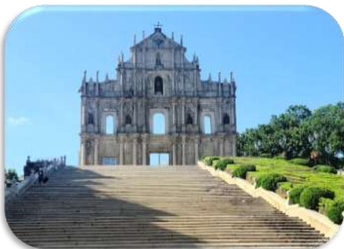
ทางเข้าแผ่นดินใหญ่

จากนั้นนำท่าน เยี่ยมชม มหาวิหารเซนต์พอล (RUINS OF ST. PAUL'S IN MACAU) โบสถ์เซนต์พอลถือเป็นสัญลักษณ์ประจำเมืองมาเก๊า ถูกสร้างขึ้นในช่วงปี ค.ศ. 1602 แล้วเสร็จในปีค.ศ. 1637 ออกแบบโดยพระนิกายเยซูอิตชาวอิตาลี โดยความช่วยเหลือของคริสเตียนชาว ญี่ปุ่น เป็นโบสถ์คาทอลิกที่มีขนาดใหญ่ที่สุดในเวลานั้น ตั้งอยู่ติดกับวิทยาลัยเยซูอิตแห่งเซนต์พอล ซึ่งเป็นสถานศึกษาแห่งแรกของชาวตะวันตกในแดนตะวันออกไกลซึ่งมีขงจื๊อผู้เผยแผ่ศาสนาใช้เป็นี่เรียนภาษาจีนที่มาเก๊าก่อนที่จะเดิน