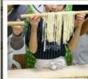
กิจกรรมทำเส้นอุด้ง