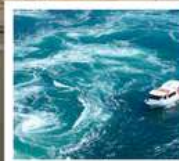
คลองเรือขมบ้านนาสุโตะ

คลองเรือขมบ้านนาสุโตะ / ซุปบึงย่านชินโซบาช / ตลาดปลาคุโรเมง / ซุปบึงย่านอูเมะ