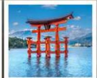
ศาลเจ้าอิตสึคุชิมะ