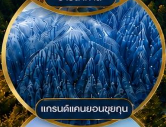
แกรนด์แคนยอนซุ่ยกุน