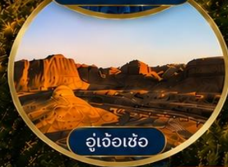
อู่เจ้อเซ่อ