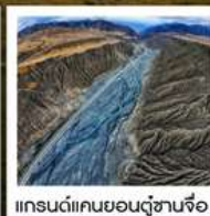
แกรนด์แคนยอนตู้ซานจือ