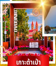
เกาะต้าเป่า