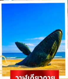
วาฬเดี่ยวตาย