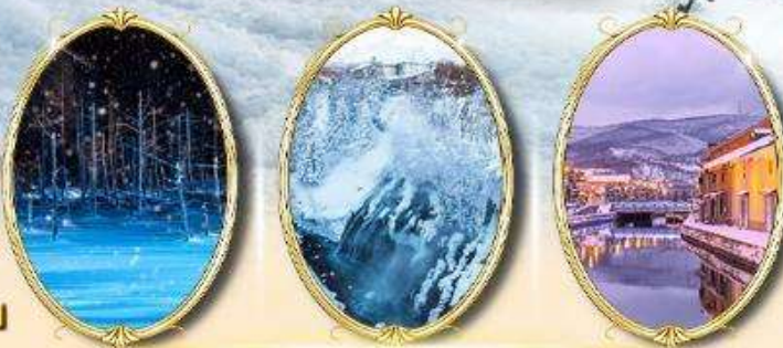
Shiragane Blue Pond Illumination

กรุ๊ป 25 ท่าน รหัสทัวร์ RJ-TG022 เดินทาง 6D 4N 09 - 14 ม.ค. 2570