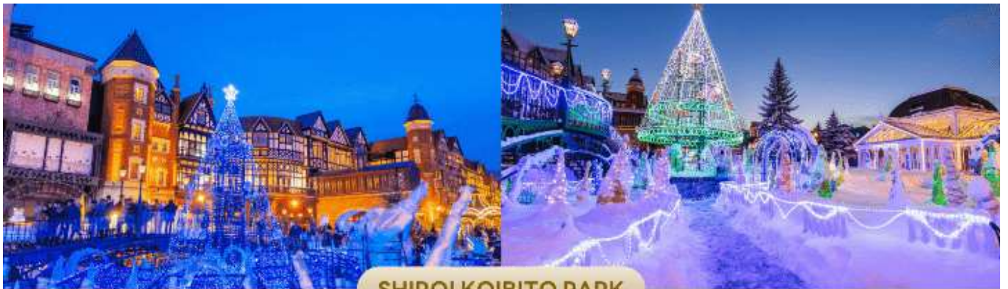
SHIROI KOIBITO PARK

นำท่านสู่ โรงงานช็อกโกแลต ชิโรอิ โคอิบิโตะ (Shiroi Koibito Park) ช็อกโกแลตชั้นชื่อของเกาะฮอกไกโดภายในบริเวณที่แห่งนี้ ประกอบด้วย ร้านค้า ร้านกาแฟ ร้านอาหาร และพิพิธภัณฑ์โรงงานช็อกโกแลตพร้อมจำหน่ายช็อกโกแลตหลากหลายรูปแบบ เป็นอีกหนึ่งสถานที่ที่สวยงามด้วยตัวตึกเป็นอาคารสไตล์ยุโรป จึงทำให้บรรยากาศนั้นเหมือนหลุดไปเดินอยู่ในเมืองโรมานติกของยุโรปเลยทีเดียว