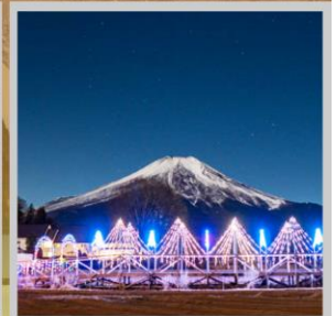
"YAMANAKAKO ILLUMINATION FANTASEUM"