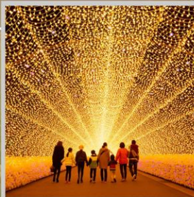
"NABANA NO SATO"