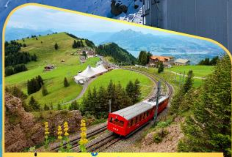
นั่งรถไฟขึ้นสู่ยอดเขาโรทิก