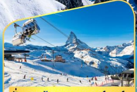
นั่งกระเช้าชมแมทเทอร์ฮอร์น