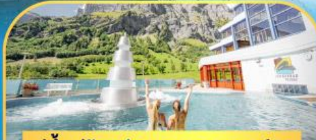
แช่น้ำแร่ร้อนผ่อนคลายคอร์มัท