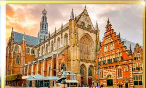
จัตุรัสเมืองฮาร์เล็ม

พรมแดนเมืองแปลกเนเธอร์แลนด์และเบลเยียม เดินเมืองเคลฟท์ เมืองเครื่องปั้นดินเผาระดับโลก ฮาร์เล็มเมืองมั่งคั่งที่สุดของเนเธอร์แลนด์