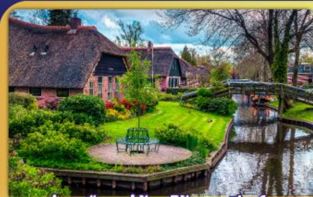
ล่องเรือหมู่บ้านไรทนนทีรุรัน