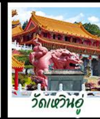
วัดเหวินอู่