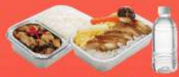
บริการอาหารร้อนบนเครื่อง ขาไป - ซากลิบ