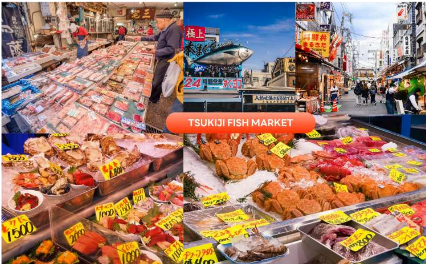
TSUKIJI FISH MARKET

คณะเดินทางถึง สนามบินนานาชาตินาริตะ ประเทศญี่ปุ่น (**เวลาที่ประเทศญี่ปุ่นจะเร็วกว่าประเทศไทย 2 ชม. ควรปรับนาฬิกาของท่านเพื่อสะดวกในการนัดหมาย) หลังผ่านพิธีตรวจคนเข้าเมืองแล้ว จากนั้นนำท่านสู่ เมืองโตเกียว (Tokyo) มหานครที่ใหญ่ที่สุดแห่งหนึ่งของเอเชีย และของโลก ประกอบด้วยแหล่งท่องเที่ยว แหล่งวัฒนธรรม ศูนย์รวมเศรษฐกิจ เทคโนโลยีทางด้านต่าง ๆ และสถานที่สำคัญทางศาสนา มากมายในมหานครแห่งนี้ที่ผสมผสานกันได้อย่างลงตัว นำท่านเดินทางสู่ ตลาดปลาซึกิจิ (Tsukiji) เป็นตลาดอาหารทะเลชื่อดังของโตเกียวเป็นหนึ่งในตลาดปลาที่ใหญ่ที่สุดในโลก เป็นแหล่งรวมอาหารทะเลสดใหม่ และอาหารญี่ปุ่นต้นตำรับ ภายในตลาดเต็มไปด้วยร้านซูชิ ซาซิมิ อาหารทะเลสด รวมถึงขนมและของฝากท้องถิ่นมากมาย ให้ท่านอิสระเลือกชิมและเลือกซื้อสินค้าตามอัธยาศัย