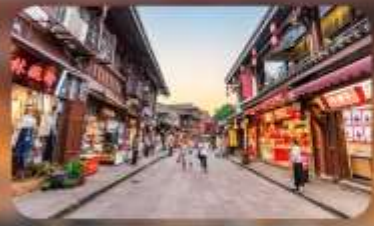
หมู่บ้านโบราณฉือซีไห่