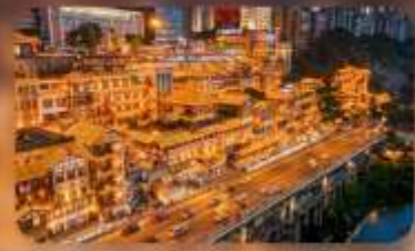
หงหย่าตั้ง