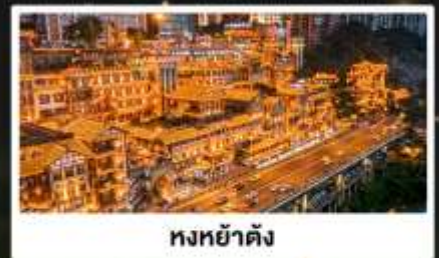
หงหย่าตั้ง