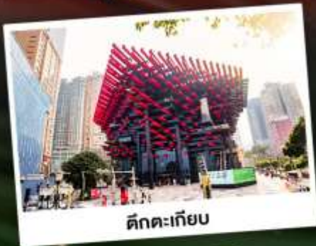
ดักทะเลียบ

เมืองแห่งขุนเขา ชมความยิ่งใหญ่ของธรรมชาติ