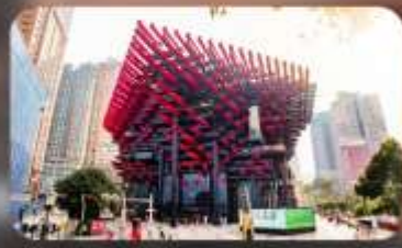
ดิคตะเกียบ