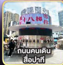
ถนนคนเดิน สี่ปาตี