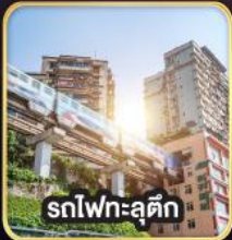
รถไฟฟ้าชุนชิ่ง