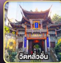
วัดหลัวอัน