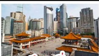
ตึกขุยซิง

พระแกะสลักหินต้าจู้ - หลุมฟ้าสะพานสวรรค์ - เจานางฟ้า ตึกขุยซิง - ตึกตะเกียบ หมู่บ้านโบราณฉือซีไห่