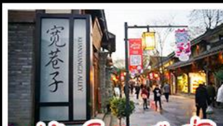
หมู่บ้านโบราณฉือซีไห่