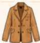
เสื้อแจ็กเก็ต หรือโค้ทตัวยาว