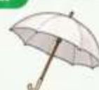
ร่มกันยูวี