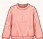
เสื้อสเวตเตอร์ถัก หรือคาร์ดิแกน