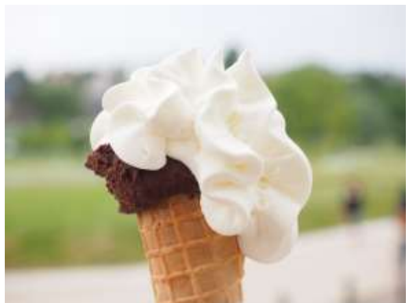
ภาพประกอบเท่านั้น