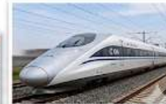
รถไฟความเร็วสูง ลี่เจียง-คุนหมิง