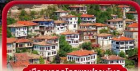
เมืองมรดกโลกซาฟรานโบลู