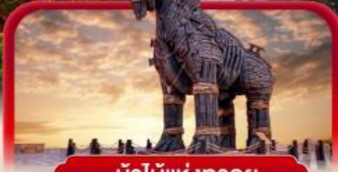
ม้าไม้แห่งทรอย