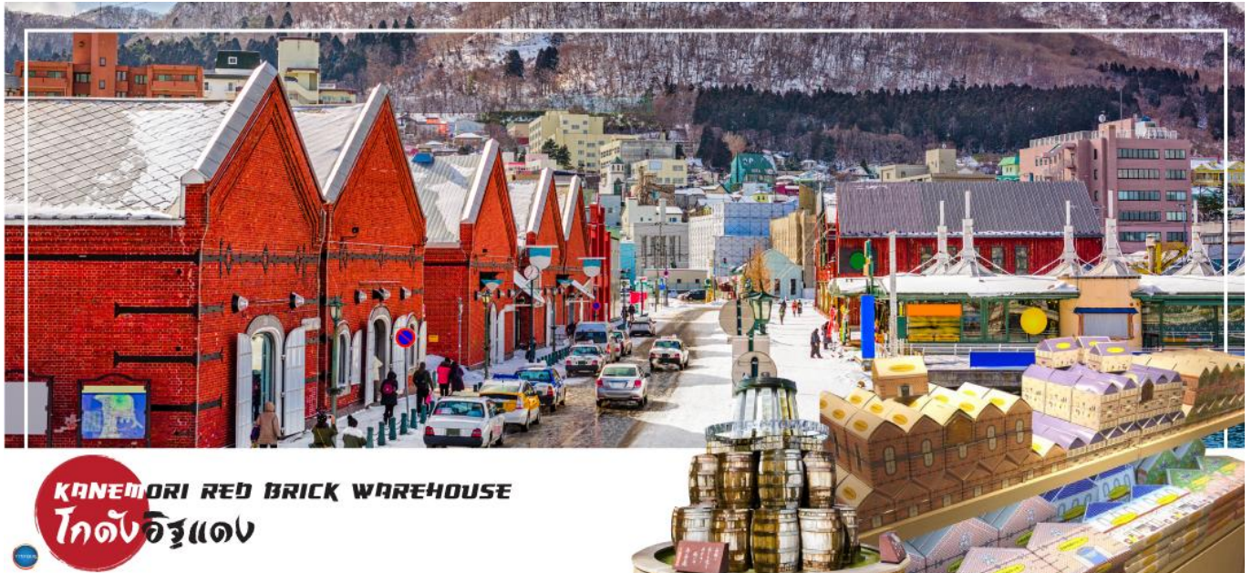
KANEMORI RED BRICK WAREHOUSE โกดังอิฐแดง

วันที่สาม เมืองฮาโกดาเตะ – ตลาดเช้าฮาโกดาเตะ – โกดังอิฐแดง – ย่านเมืองเก่าโมโตมาชิ – ป้อมโกเรียวกาคู (เช้าชม) – ทะเลสาบโทยะ – ออนเซน