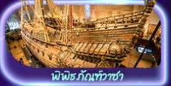
พิพิธภัณฑ์ทว่าซา