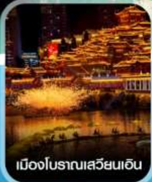
เมืองโบราณเสวียนเอน