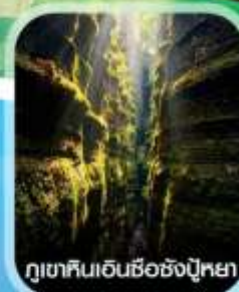
ภูเขาหินเอนชือชิงปู้หยา

คอนเฟิร์มออกเดินทาง ทุกพีเรียด 2 ท่านขึ้นไป