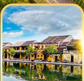
เมืองมรดกโลกฮอยอัน