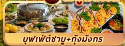
บุฟเฟ่ต์ซาบู+กุ้งมังกร