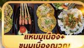
แชนมูเนื่อง+ขนมเมืองญวท