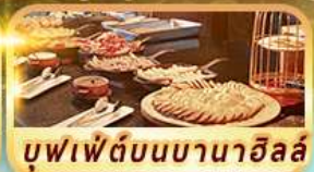
บุฟเฟ่ต์บนบานาฮิลล์