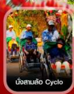
นั่งสามล้อ Cyclo