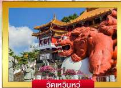
วัดเหวินหัว