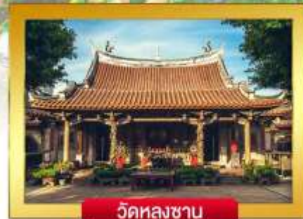
วัดหลงซาน