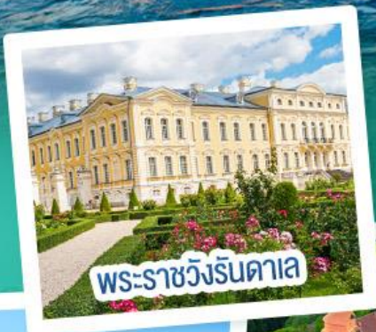
พระราชวังรินดาเล