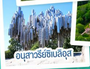
อนุสาวรีย์ซิบิลูส