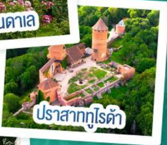
ปราสาทกูโรด้า